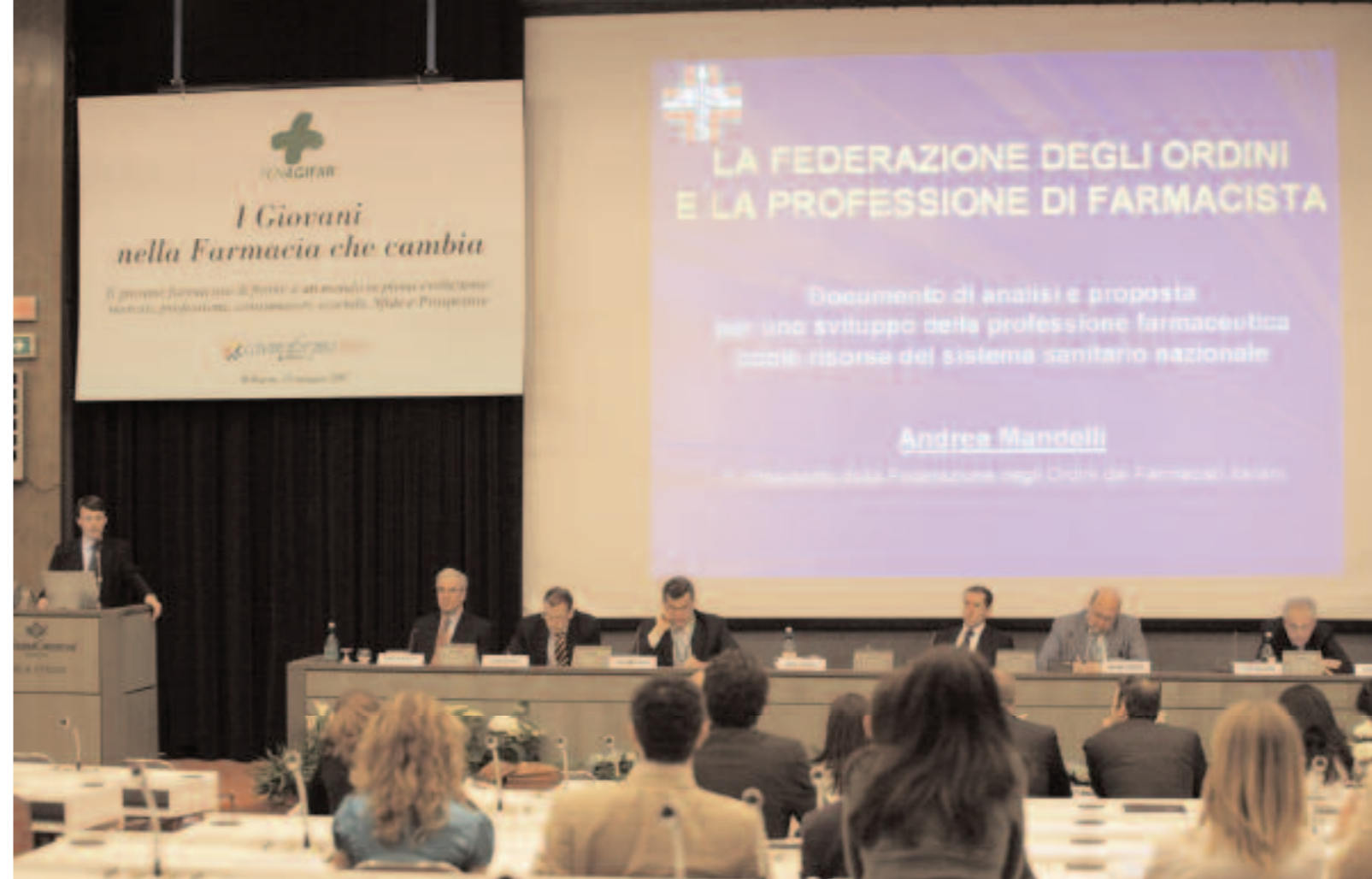
Un'immagine del tavolo dei relatori al convegno di Fenagifar, tenutosi nell'ambito di Cosmofarma Exhibition 2007